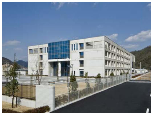
上郡中学校新築工事 2009年3月竣工