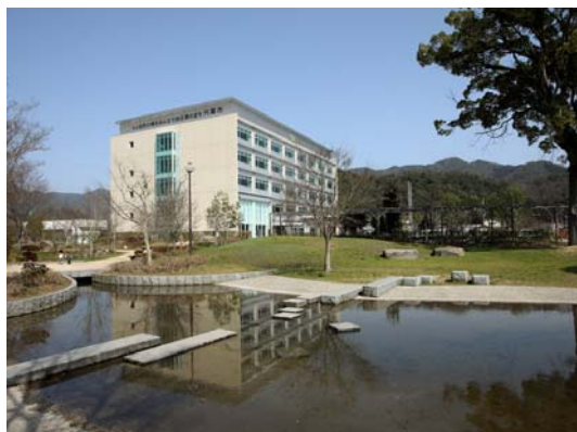
天栄市新庁舎建設工事 2009年3月竣工